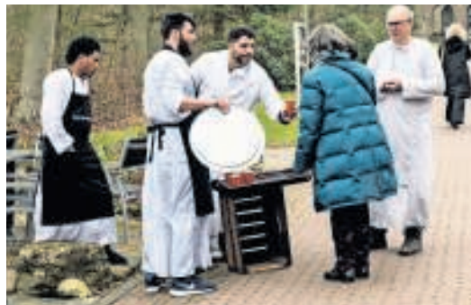
▲ Bezoekers van Orientalis proeven oosterse gerechten. TEKST EN FOTOS EVA DE WAAL/PAUL RAPP

Wat: Proeven van het Midden-Oosten Waar: Museumpark Orientalis in Nijmegen Wanneer: tot 28 oktober