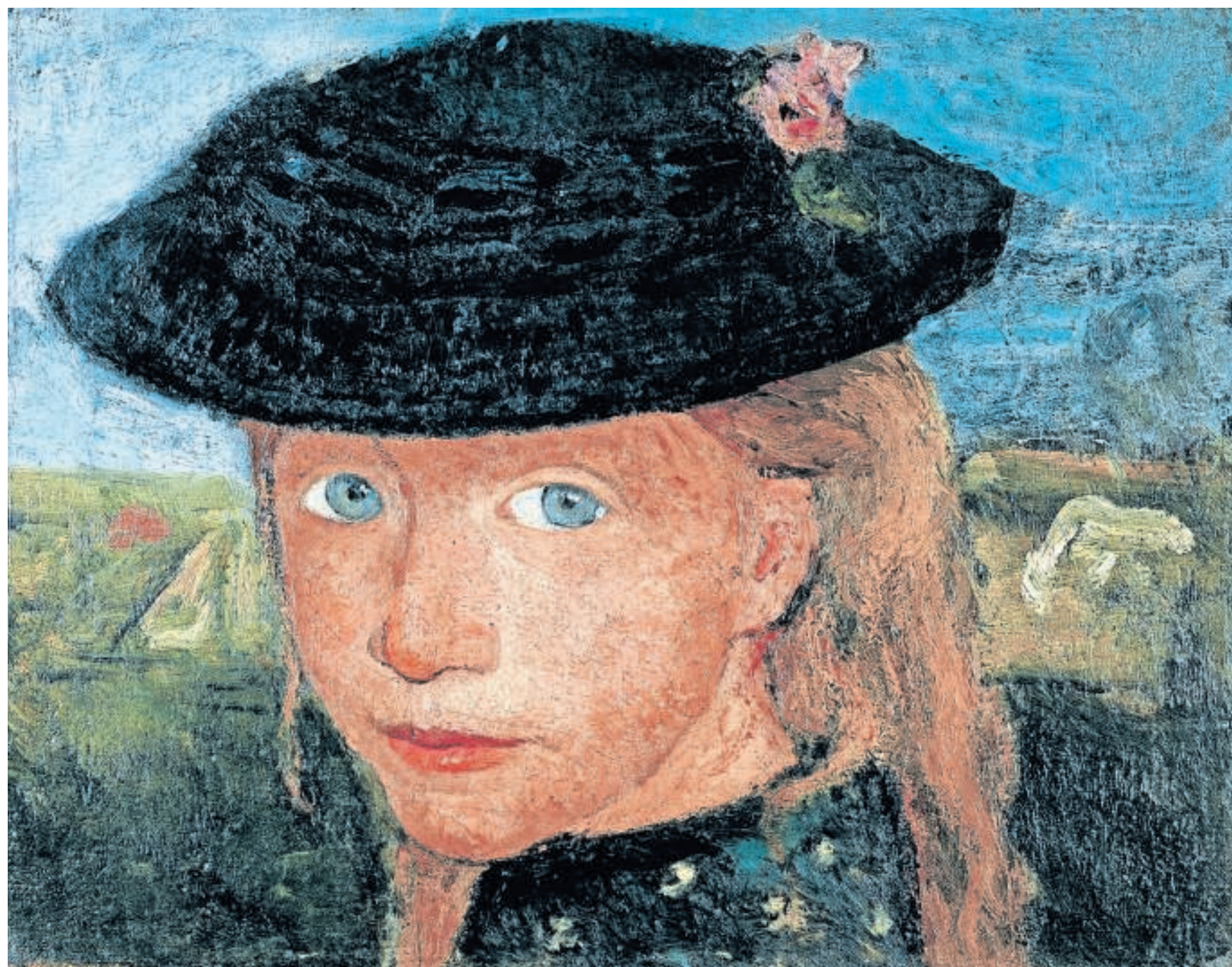
◀ Het werk van Paula Modersohn bevat veel portretten en kinderafbeeldingen.

► Verschijnt 10 april bij Fontaine, 29,99 euro