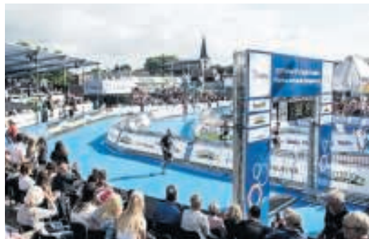
▲ De triathlon in Holten TEKST KARIN VELDWACHTER

Wat: Triathlon Waar: Holten Wanneer: 30 juni en 1 juli